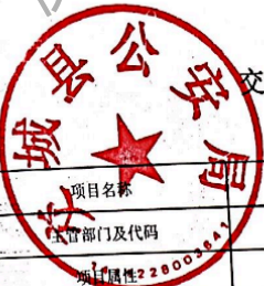
交城县县(区)级预算部门(单位)项目支出绩效目标表