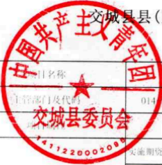
交城县县(区)级预算部门(单位)项目支出绩效目标表