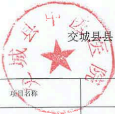
交城县县(区)级预算部门(单位)项目支出绩效目标表 (2026年度)