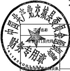
遗属人员补助项目支出绩效自评表 (2024年度)