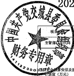
2024年其他运转工作经费项目支出绩效自评表 (2024年度)