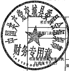
选派到村任职干部工作经费项目支出绩效自评表 (2024年度)