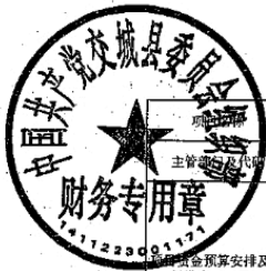
人才工作经费项目支出绩效自评表 (2024年度)