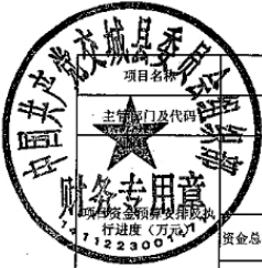
机关网络运行费用项目支出绩效自评表 (2024年度)