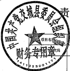
责任制考核业务经费项目支出绩效自评表 (2024年度)