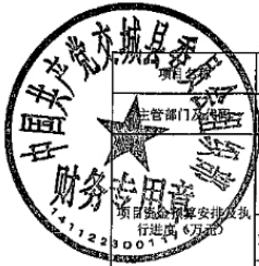
2024年政府购买人员工资项目支出绩效自评表 (2024年度)