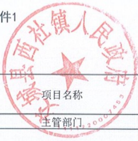
交城县项目支出绩效目标自评表 (2023年度)