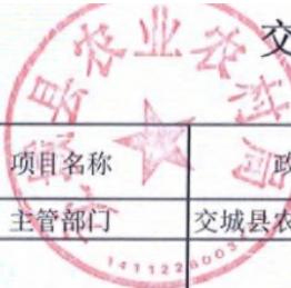
交城县项目支出绩效目标自评表 (2022年度)