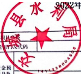
2022年世行节水贷款还本付息项目支出绩效自评表 (2022年度)